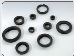
Guarnizioni in gomma