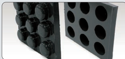
Stampi per il modellismo e l'industria