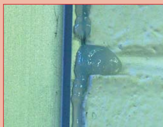
Sigillatura elastica di fessure