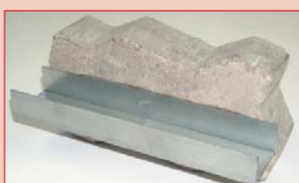
Incollaggio a calcestruzzo