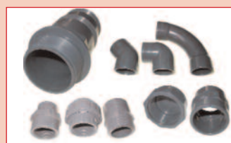
Encolado de plástico