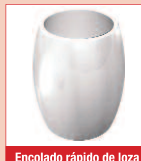
Encolado rápido de loza y porcelana