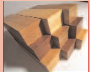
Encolado de madera