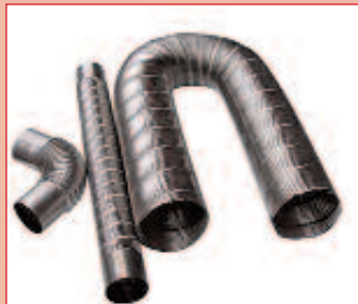
Encolado de acero