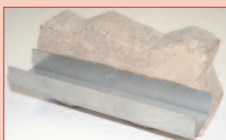
Encolado de hormigón