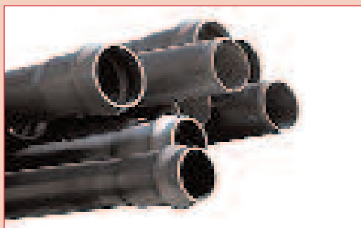
Encolado rápido de plástico