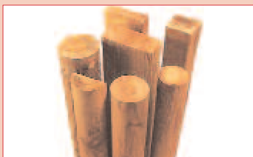
Encolado rápido de madera