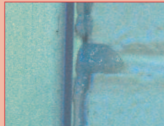
Sellado elástico de fisuras