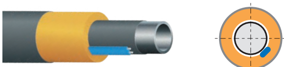
Frostschutz-Trassenführung für Rohrleitungen, lineare Längsführung 1 m Kabel/ m Rohr.