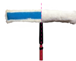
Shiny Brush SB4

Pour l'application correcte du produit également dans les zones difficiles à atteindre "à bout de bras", une brosse en microfibre montée sur un bras télescopique allant jusqu'à 4 m est disponible.