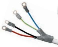
Creazione di terminali BT