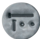
Preparazione in loco di piccoli stampi per impronta