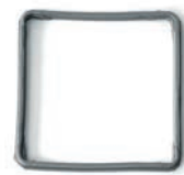
Preparazione in loco di guarnizioni