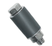
Preparazione in loco di espansori per tasselli