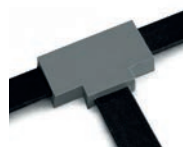
Isolamento calate, sbarre, passanti di trasformatori