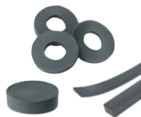
Preparazione di barre, rondelle, tondi isolanti