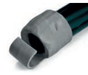
Preparazione di deflettori, ugelli, deviatori di flusso