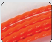
Speedy Helix 4 Poliéster Ø 4 mm com anel e cabeça flexível fixa