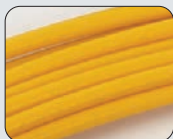
Speedy Glass Guia em fibra de vidro Ø 3 mm de cabeça intercambiável