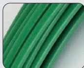
Speedy Steel Guia em nylon aço Ø 6 mm